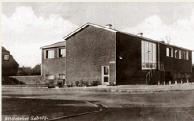
Det splinternye hovedbibliotek på et postkort anno 1940.

På Gladsaxevej 111 ligger endnu et af arkitekt Vilhelm Lauritzens huse. Det rummede en periode kommunens samling af afrikansk kunst, men det blev bygget allerede i 1939-40 for at huse kommunens hovedbibliotek. Ideen var, at man ville bygge et fuldstændig identisk hus i Bagsværd, ligeledes til bibliotek, men p.g.a. krigen blev planerne udskudt og sidenhen skrinlagt. Da Høje Gladsaxe Centret stod klar til indflytning (selvom det ikke var 100% færdigbygget endnu), rykkede hovedbiblioteket derover. Det var i 1966. I stedet fik kunst- og musikafdelingen til huse på Gladsaxevej 111. Først i 1979 kunne man samle hovedbiblioteket under det nuværende tag på Søborg Hovedgade 220. I dag ejes huset af druideordenen.